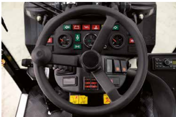
Tableau de bord

Le tableau de bord vous permet de voir en un seul coup d'oeil la température du liquide de refroidissement et le niveau de carburant. Des témoins lumineux vous avertissent de problèmes sur la pression d'huile, la charge ou la température.